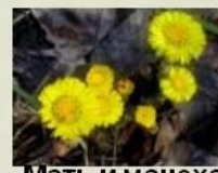
Мать и мачеха